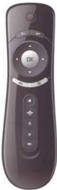
Изделие: Пульт дистанционного управления Модель: IH-AM02